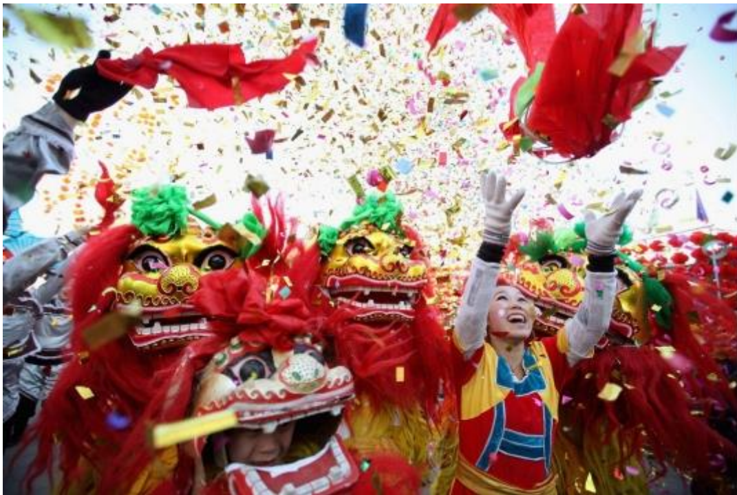
Fotografía de la Festividad de Año Nuevo Chino (2021).

Año Nuevo Chino (春节 Chūnjié): El segundo día festivo importante de cada año es el Año Nuevo Chino, también conocido como el Festival de Primavera. Esta fiesta es la más importante de todas las festividades chinas. Dado que se basa en el Calendario lunisolar chino, la fecha varía de un año a otro, pero generalmente se celebra a finales de enero o a principios de febrero.