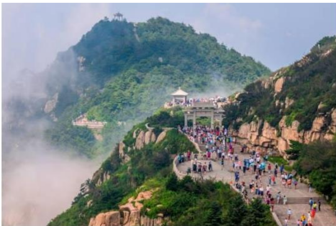
Vista aérea del Monte Taishan.

El folklore de Shandong también es un atractivo para los turistas. En tal sentido, destacan la ceremonia de adoración al mar de las zonas costeras en la península de Jiaodong, el Jiaozhou Yangko (un baile popular tradicional rural), cuentan con los folklores únicos de los pescadores locales. A esto se le agrega los cometas de Weifang, la imagen de madera de Año Nuevo de Yangjiabu, el papel el corte de Gaomi, y el esmalte de color de Boshan son representantes de la cultura del agricultor, y las artesanías populares y las costumbres del oeste de Shandong tienen raíces profundas en la tradición de la cultura confuciana (Shandong China, s.f.).