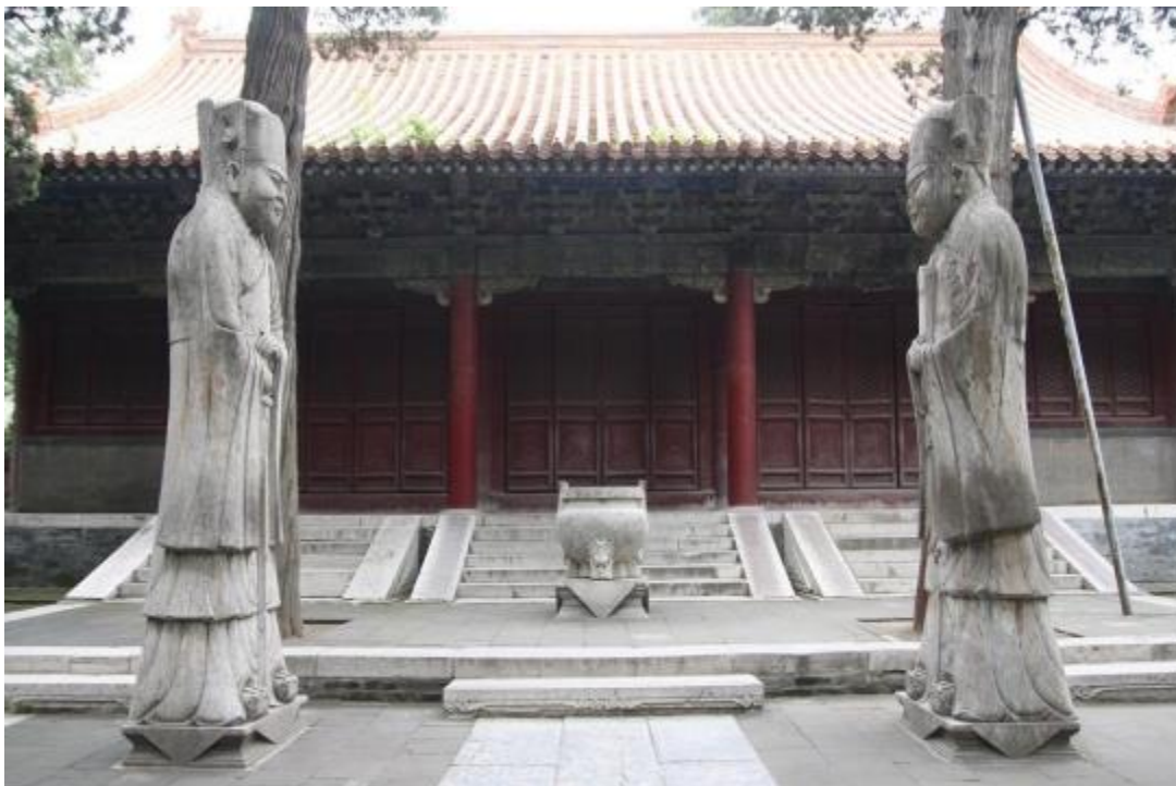
Templo y cementerio de Confucio en la ciudad de Qufu, Shandong (2020).

Shandong representa una variedad de recursos turísticos. Su paisaje natural, numerosas reliquias y monumentos culturales son algunos de sus mayores atractivos. El Monte Taishan, considerado como «patrimonio natural y cultural del mundo» y «el mejor de los cinco cerros», el templo, la Casa Grande y cementerio de Confucio, considerado «patrimonio cultural mundial» y «la ciudad internacional de la cerveza» y Yantai, la “Ciudad Internacional del Vino” (Shandong China, s.f.).