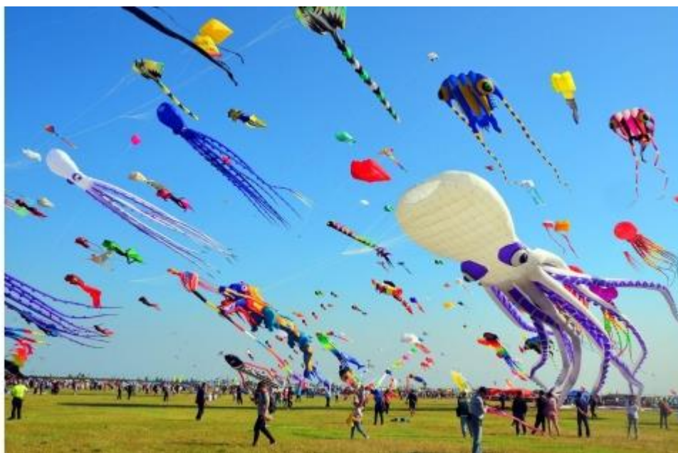
Festival Internacional de Cometas en Weifang, Shandong (2021).

Festival Internacional De La Cerveza en Qingdao: Desde 1991, cada año en el segundo sábado del mes de agosto, durante 16 días se reúnen miles de personas a celebrar la gran fiesta nacional. Donde se combinan el turismo, la cultura, deportes, la economía y el comercio. En este sentido, es interesante mencionar que el lema principal de la Fiesta de la Cerveza de Qingdao es “Brindemos con el mundo” (Shandong China, s.f.