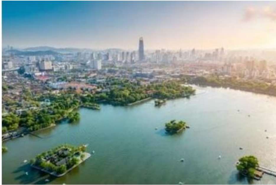
Vista aérea de la capital de la Provincia de Shandong, Jinan (2021).